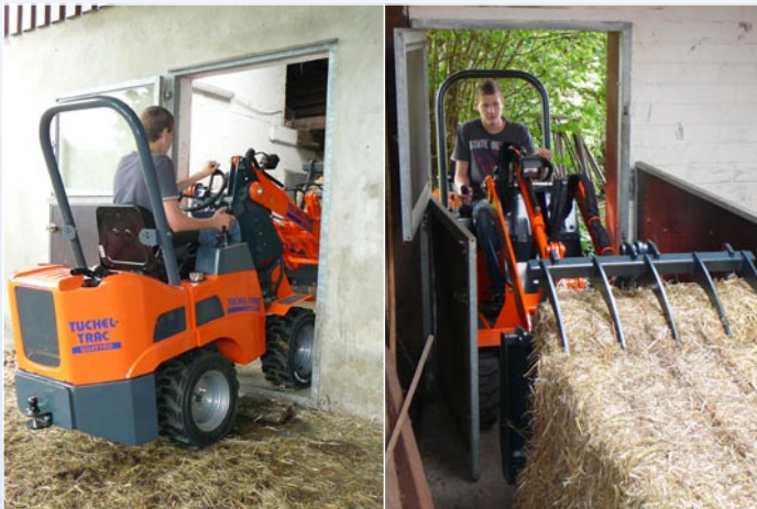
Einfaches Arbeiten selbst auf kleinstem Raum

Der Tuchel-Trac Quattro ® ist das Trägerfahrzeug eines innovativen und vielseitigen Fahrzeugkonzeptes. Zusammen mit den umfangreichen Tuchel-Werkzeugen und Anbau-Vorsätzen wird der Tuchel-Trac-Quattro im Handumdrehen zum vielseitigen, wendigen und kraftvollen Arbeitsgerät rund um Baugewerbe, Hof-, Stall- und Landschafts-Pflege.