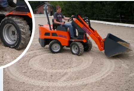
Voller Lenkeinschlag – extreme Wendigkeit