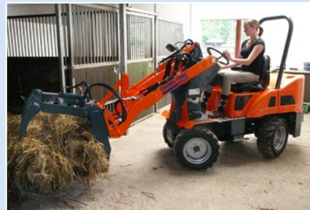
Minimiert schwere körperliche Arbeiten