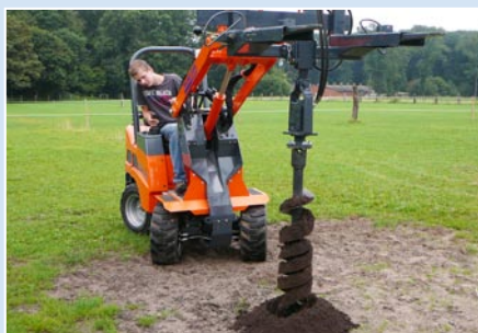
Große Auswahl an Anbaugeräten