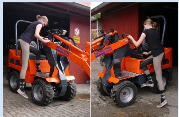
Einfacher Einstieg von beiden Seiten möglich