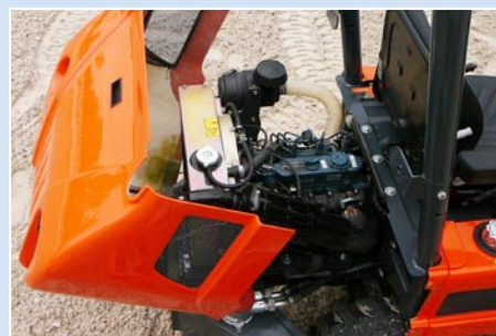
Sauberer, geräuscharmer, leistungsstarker Motor