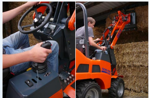
Bedienung mit nur einer Hand per Joystick